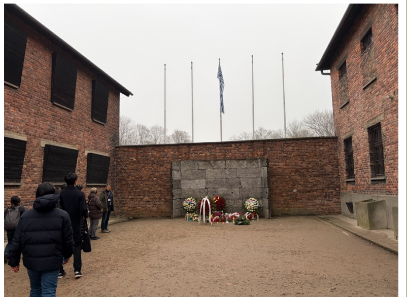
アウシュビッツ訪問記③

面倒くさくて、やる気が起こらないことを億劫と言います。「宿題をするのが億劫」とか「お風呂に入るのも億劫だ」などと言いますね。もともとは仏教語の「おっくう」がなまったものです。「劫」とはとても長い時間のこと。どれくらい長いかというと一辺の長さが60キロもある立方体の箱に、100年に一度ケシの実を一粒ずつ入れて、満杯になると一劫。それを一億回も繰り返してやっと億劫になるというわけです。億劫の年月を重ねても自ら得ることができない仏さまの真実の教えに出会えたことを喜ばせていただきます。