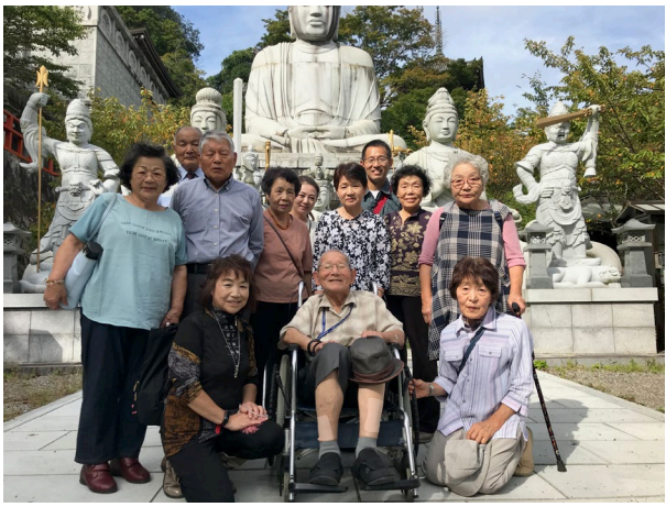
2019年9月、門徒の皆さんと壺坂寺で前住職

いつも人と話すのが楽しみで最後までお念仏・感謝の日々でした。中学校での教育、お寺の法務、日曜大工や浪曲など、常に前向きでしたが、いろいろなことがあった波乱万丈の人生だったと思います。みなさん本当にお世話になります、ありがとうございました。