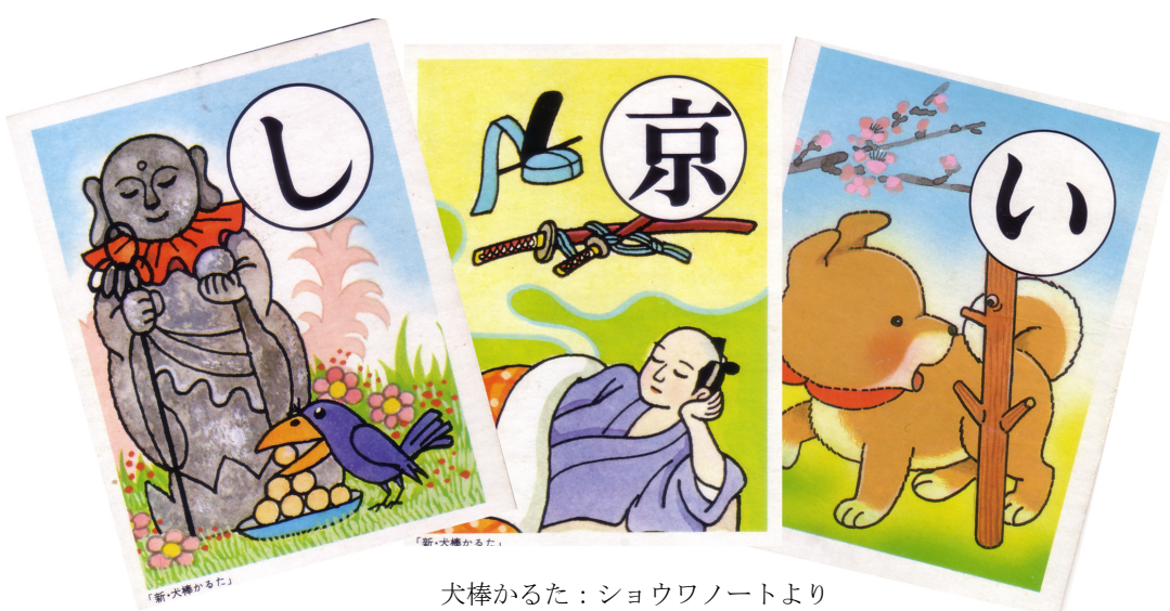
犬棒かるた：ショウワノートより