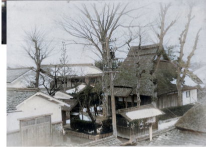
上 昭和10年の航空写真 下 旧覚浄寺。 鳳城住職が写っている

旧豊郷小学校で、昭和一〇年一〇月に撮影された航空写真の展示が行われていました。当時の村長が八日市の航空隊に依頼して撮影されたものだったので、安食西の家々も写されていました。今と比べて森や藪が多く、とても豊かで穏やかな暮らしを思わせる風景です。よく見ると覚浄寺も写っています。今のお寺の前の古い本堂築二四〇年で、前住職は「隙間だらけで怖かった」とよく言っていました。(下の写真)