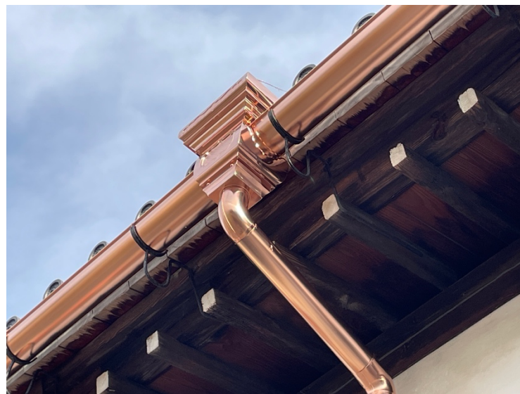
雨樋(あまどい)を修理完了

本堂の後ろ側の雨樋を新しいものに取り替えていただきました。これまで長い年月の風雨や大雪でたくさん穴が開き、雨が降ると道路に滝のように水が漏れて困っていました。今回の工事とても美しくなりました。見た目は銅製のように見えますが、酸性雨でも痛みにくい素材でできているそうです