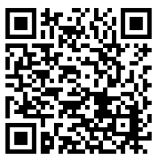
朝のお勤めライブ配信。 右のQRコードをスマホで読み取るか、「覚浄寺」で動画検索して下さい。

境内に植えられているサルズベリが咲き始めました。別名「百日紅」と言われるとおり、長い期間花を楽しむことができますので、お近くを通られる際には是非ご覧下さい。この木は幹の成長に伴って古い樹皮がはがれて落ちてしまいい、その下にある若い表皮がサルも滑るほどスベスベしていることからこの名前になったようです。